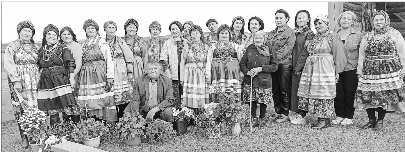
Участники смотра-конкурса в Билютае