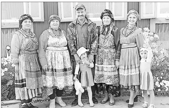
Участники презентации усадьбы в Бичуре