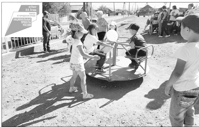
На площадке в Шибертуе

Первые площадки, благоустроенные по программе «1000 дворов», сданы в июле 2022 года.