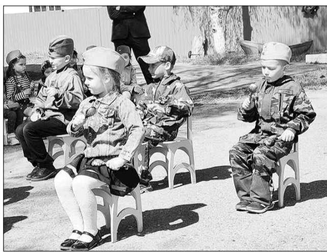
Детсадовцы порадовали гостей концертом

Со слезами на глазах они вспоминали своё военное детство, и, несмотря на то, что некоторые моменты уже стерлись