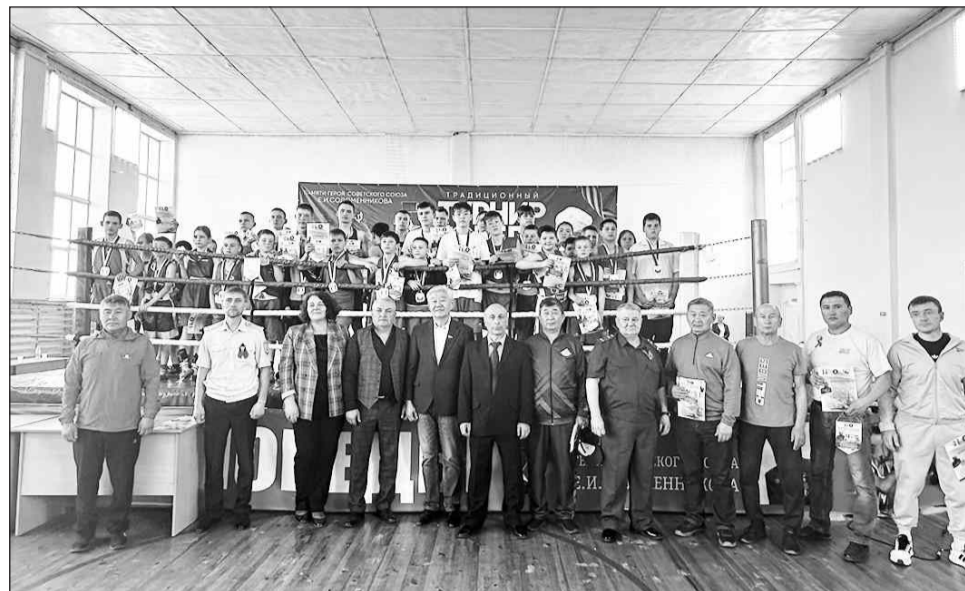
В спортивном зале ДЮСШ

6–7 мая в спортивном зале Бичурской ДЮСШ прошел 46 Открытый республиканский турнир по боксу памяти Героя Советского Союза Е.И. Соломенникова, посвященный Победе в Великой Отечественной войне.