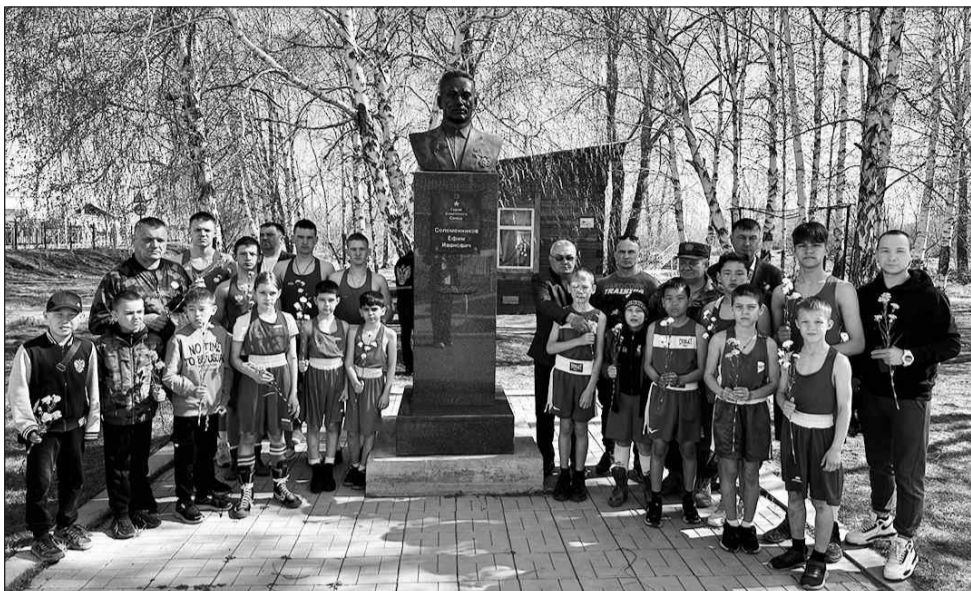
У памятника Е.И. Соломенникову