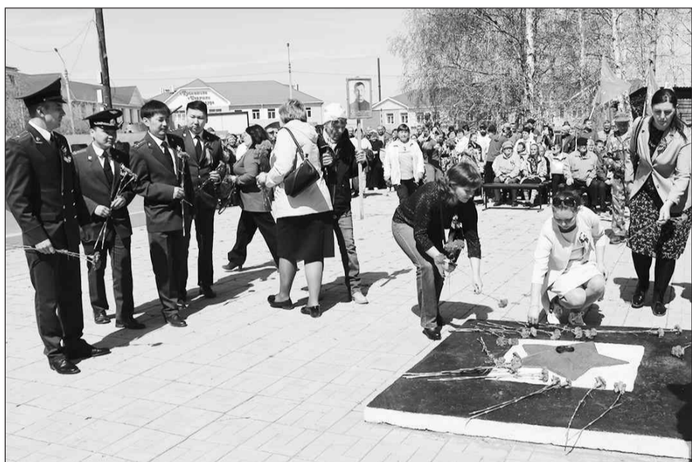
«Поклонимся великим тем годам...»

Во второй половине дня на площади РДК прошёл праздничный концерт «Победа на все времена». По окончании в зрительном зале кинотеатра демонстрировали фильмы о Великой Отечественной войне.