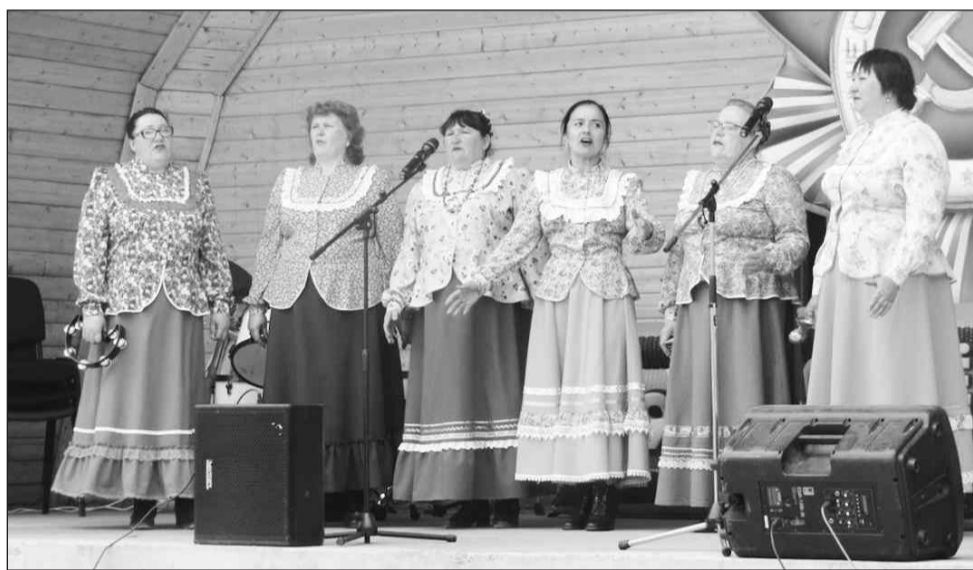
Вокальный ансамбль «Околица»