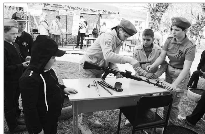
На выставке «Боевого братства» военным делом активно интересовались дети