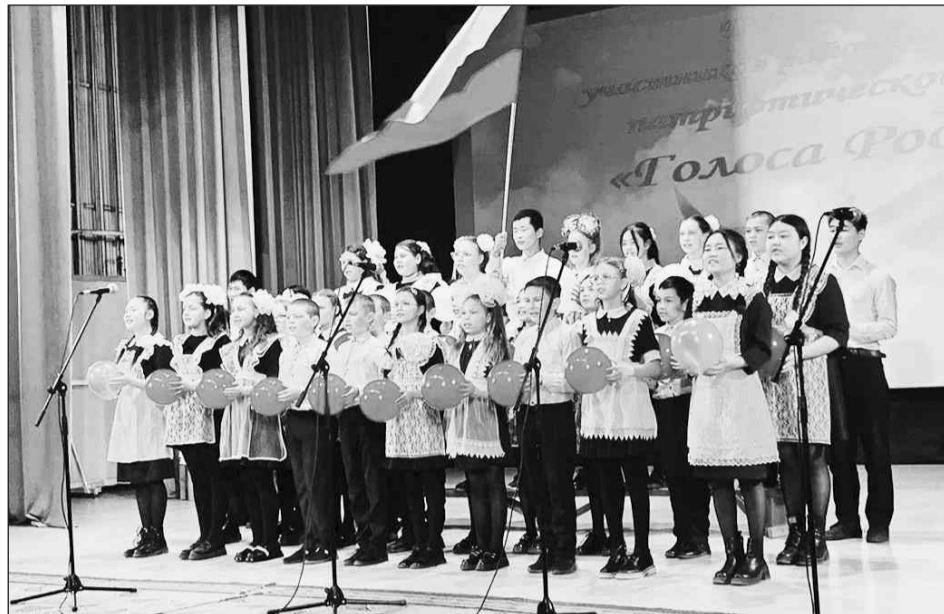
На сцене ученики Окино-Ключёвской школы

1 мая в районном Доме культуры прошёл Гала-концерт участников районного конкурса патриотической песни.