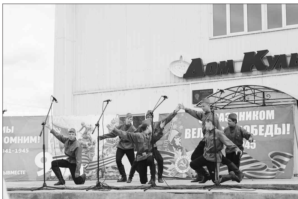
На сцене воспитанники Центра помощи детям