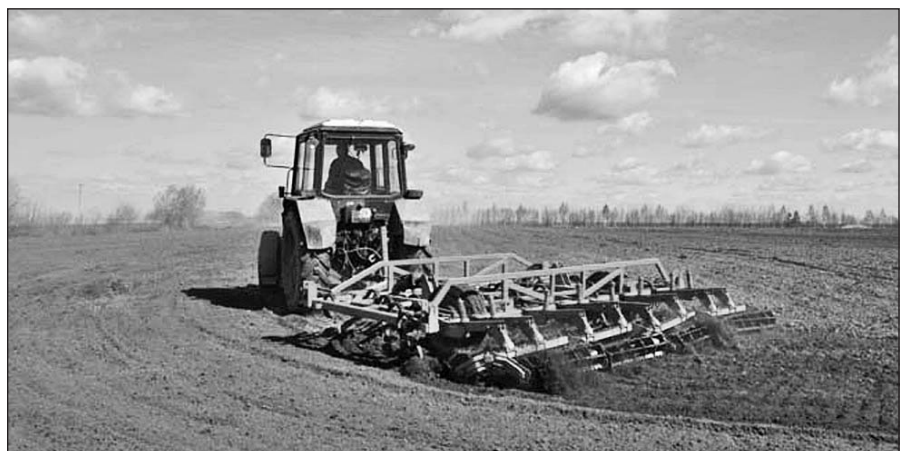
На полях хозяйств Бичурского района — горячая пора