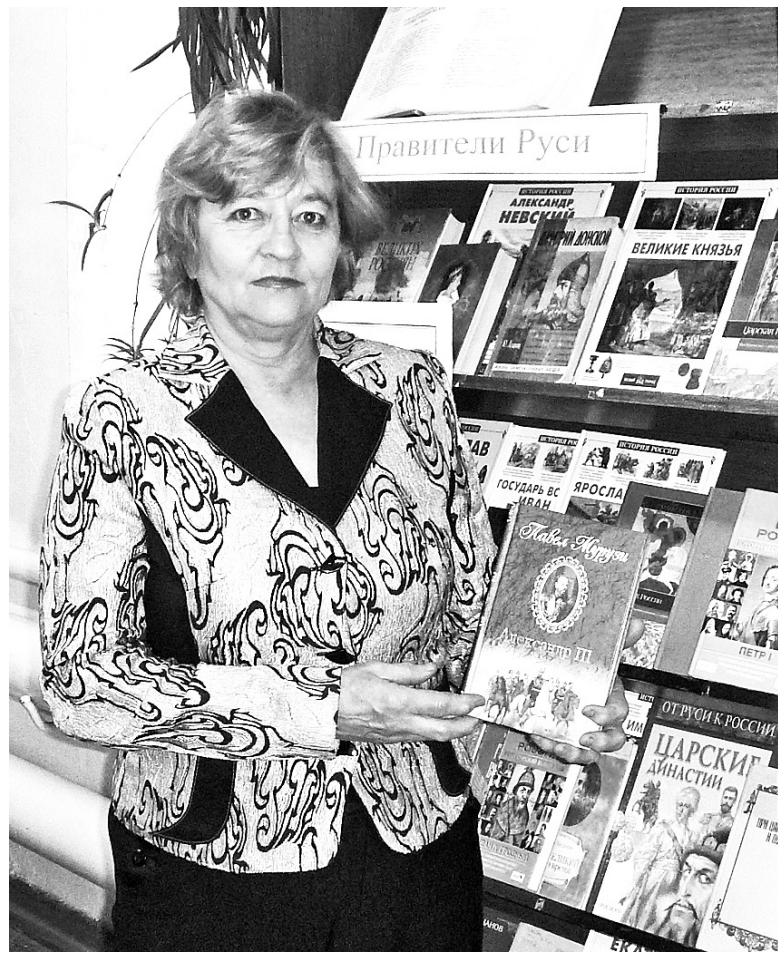
В библиотеке всегда есть, что предложить читателям