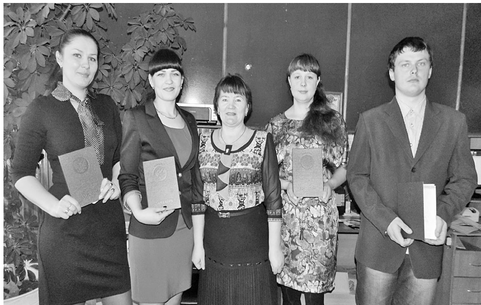
В добрый путь, выпускники!