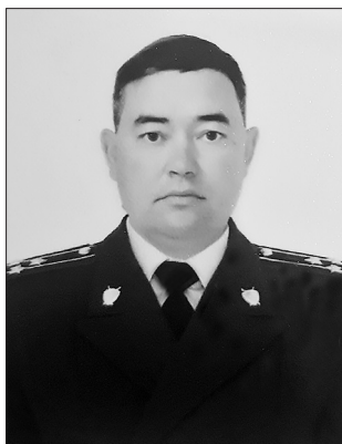
здоровья, семейного благополучия, успехов во всех делах и начинаниях.

Коллектив прокуратуры Бичурского района поздравляет работников и пенсионеров органов прокуратуры РФ с профессиональным праздником — Днем работника прокуратуры! Искренне желает крепкого