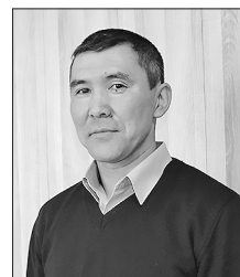
Полосу подготовила Татьяна Утенкова

— Мне случалось оказаться в таком месте. Это было прошедшим летом у подножия Саян, когда мы возили ребят из Хонхолоя в Тунку на отдых. Величественная панорама могучих, грозных гор поражает. Невольно задумываешься над тем, как человек зависит от природы. Сочетание снега и растительности, мощи гор, водопадов и маленьких речушек — всё это не перестает удивлять меня. Стоя на перевале, любящая красотами, растапливающимися перед тобой. Побывав в горах однажды, хочется вернуться туда вновь.