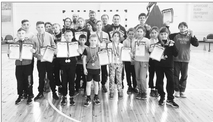
Товарищеская встреча по легкой атлетике с. Бичура — с. Тарбагатай на призы «ИП Желеков»

С егодня быть здоровым — это модно! Правильное отношение к себе, к своему здоровью, к природе и окружающим людям, любовь к спорту, отсутствие вредных привычек создают основу для здорового образа жизни, а также большую роль играет развитие патриотического воспитания учащихся. Именно с таким девизом и отношением к окружающему миру, воспитанники Бичурской ДЮСШ участвуют в различных соревнованиях и занимают призовые места.