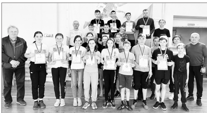
Первенство по настольному теннису, посвящённое 300-летию образования села Бичура

6 ноября 2022 года на хоккейной коробке Бичурской школы № 3 прошло открытие зимнего спортивного сезона. Воспитанники Бичурской ДЮСШ провели игры по хоккею с мячом между командами «Старт» и «Бенди». По результатам игр места распределились следующим образом: возрастная категория 2009–2011 г.р. «Старт» — 1 место, «Бенди» — 2 место, «Старт 1» — 3 место. Номинации: