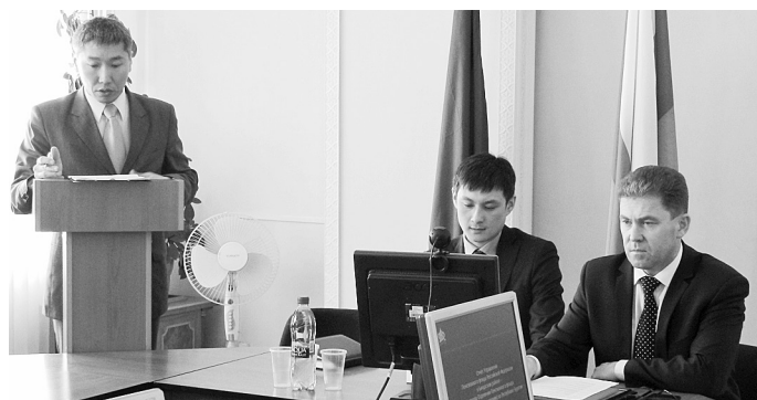
Рабочий момент совещания