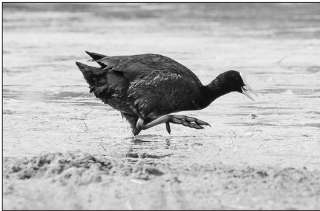
Лысуха хорошо плавает и ныряет