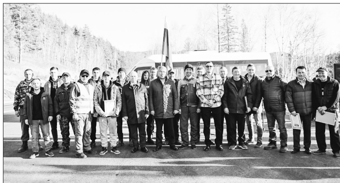
Дорожные строители с руководством республики

Торжественное открытие участка республиканской дороги Мухоршибирь — Бичура — Кяхта на Заганском перевале с 24 по 34 км состоялось 15 октября. Эта дорога имеет большую социальную значимость — связывает населенные пункты Бичурского района со столицей Бурятии, с федеральной трассой.