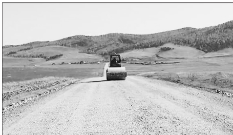
Автодорога Дабатуй - Шанага - Хонхой с 0 по 7 км

С 1 по 17 октября хозяйственно-транспортный отдел МО «Бичурский район» провёл следующие работы.