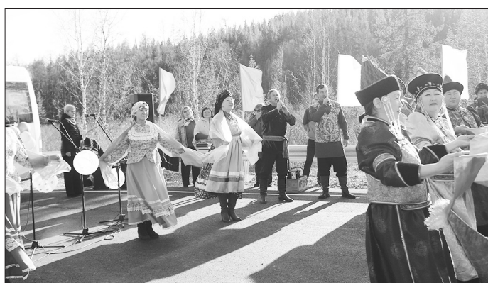
Украсили праздник концертными номерами работники культуры района