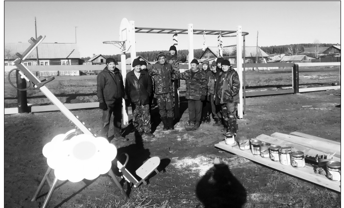
Строительство детской спортивно-игровой площадки. ТОС «Мишутка»