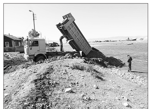
Улица Пушкина. 9 июня