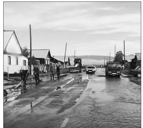
Вода и по дороге