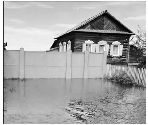
Улица Коммунистическая. 9 июня