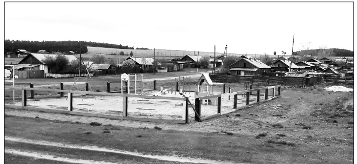
Общий вид площадки