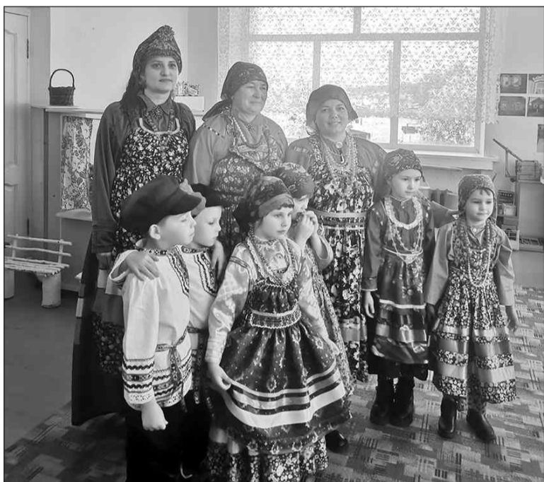
В «Подснежнике» на мастер-классе