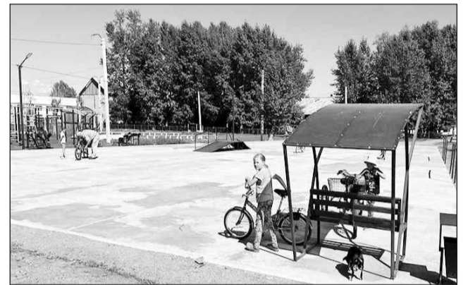
Роллердром в п. Молодежный