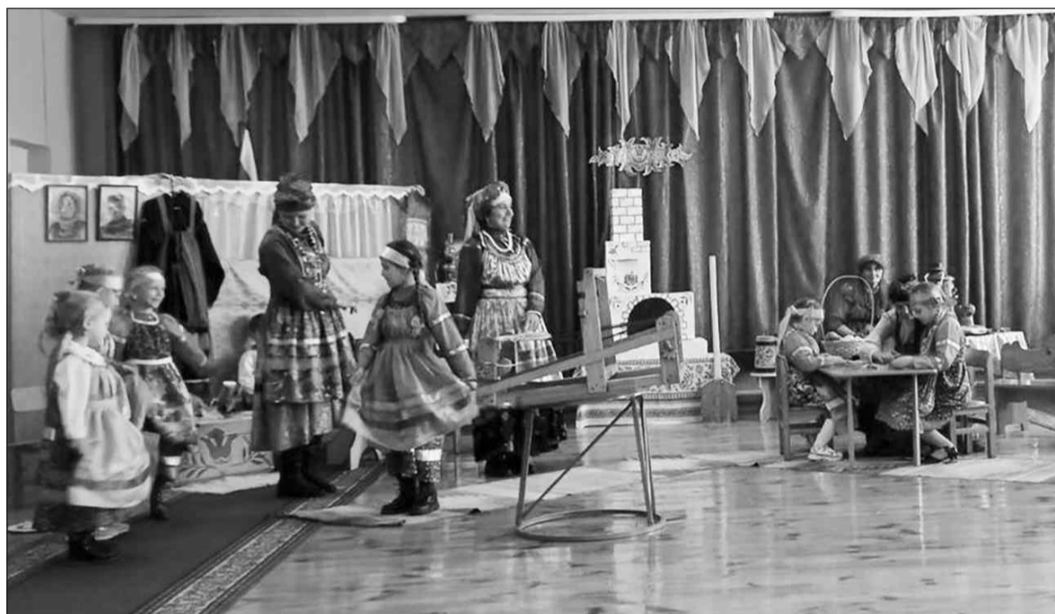
Работа в импровизированной избе в «Теремке»

С 2018 года детский сад «Подснежник» стал республиканской стажировочной площадкой, а детский сад «Теремок» — республиканской творческой лабораторией по приобщению детей дошкольного возраста к истории и культуре семейских Забайкалья.