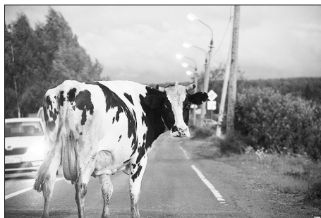
Бурятия «Об административных правонарушениях» статьи 47 «Выпас сельскохозяйственных животных вне установленных органами местного самоуправления мест».

Конечно, легче выпроводить скотину на улицу, не думая, какой вред она может нанести обществу. Но хозяева вольно пасущегося скота забывают, что за нарушения Правил предусмотрено наказание в виде административного штрафа в размере от 1000 до 5000 рублей, согласно Закону Республики