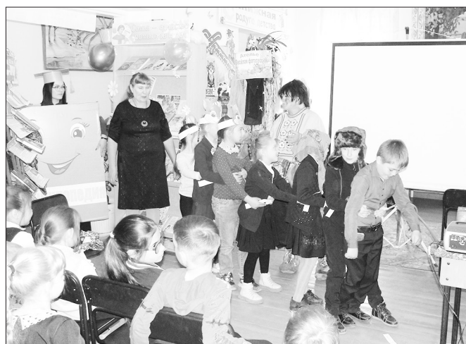
Дети активно участвовали в инсценировках

19 мая прошла социально-культурная акция в поддержку книги под девизом «Время читать». В течение дня в библиотеке работала интерактивная площадка «Книгосветное путешествие».