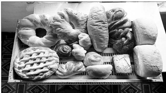
Продукция пекарни Т.А. Ткачёвой