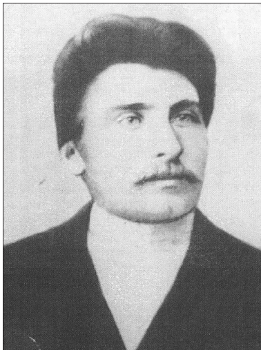
Ф. Н. Вахмянин (1885–1930)