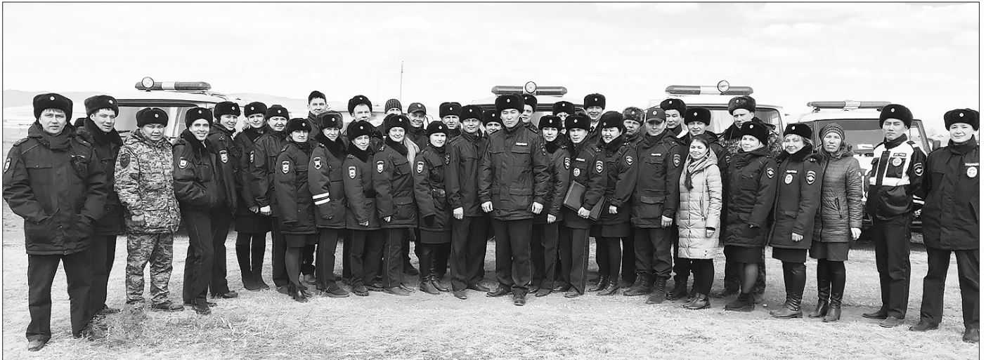
Личный состав отдела на учениях. 2019 г.

10 ноября профессиональный праздник отмечают сотрудники ОМВД России по Бичурскому району. Выбрав профессию полицейского, они приняли на себя ответственность за безопасность населения, обеспечение прав и свобод, защиту законных интересов граждан.