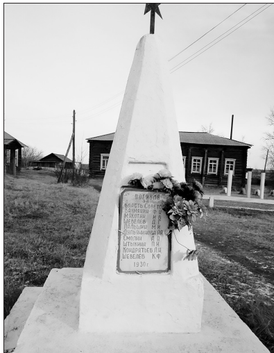
Памятник погибшим в дни кулацкого мятежа