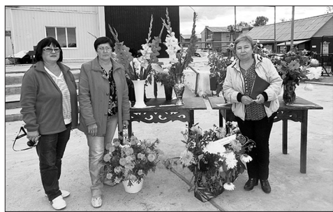
Работники РДК — организаторы и участники выставки