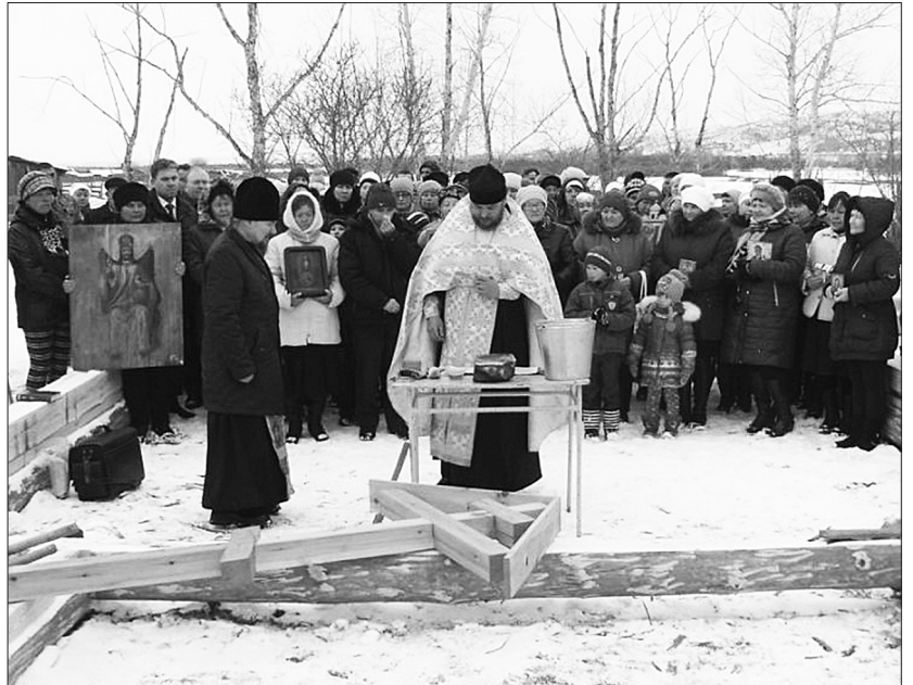
Многочисленные жители пришли к месту основания новой церкви