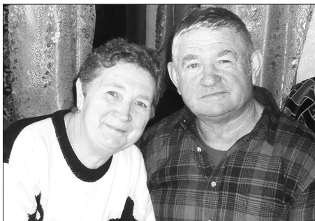
45 лет одной судьбой

Как бы перемены ни происходили в мире, в обществе, семья для каждого человека остается надежным причалом, где он всегда черпает живительные силы и обретает себя.