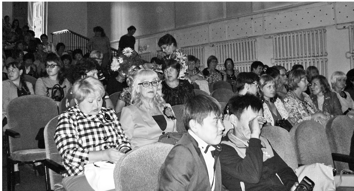
Перед началом конференции

В системе общего образования Бичурского района на 1 сентября 2016 года работает 22 общеобразовательные школы. За парты сядут 2917 учащихся, что на 200 человек больше, чем в прошлом учебном году. Из них 318 первоклассников, 120 выпускников 11-х классов.