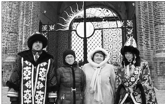
У стен Казанского Кремля

В выступлениях чувствовалась озабоченность проблемами, с которыми сталкивается Россия на пути увеличения рождаемости и улучшения качества жизни семей, в их числе — высокий про-