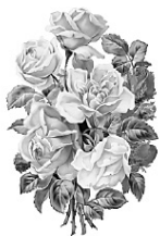
Дети, внуки, правнуки

Мама, бабушка, родная наша! Сегодня важный праздник твой И поздравляет вся твоя семья, Ты самый человек родной! Пустькой тебе живется хорошо, И не тревожат выгои за окном. И пожеланий искренних мешок Тебе сегодня вместе мы несем — Там есть детей твоих немного слов, И есть, конечно, что-то от внучат, И, как оттенки полевых цветов, Они о чем-то добром говорят! Нам от окошка твоего светло, Пусть вечно солнце в нем сияет, И наши теплота, любовь, Тебя, родная, согревают!