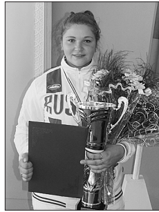
Кристину ждут новые победы

По итогам всероссийского соревнования «Олимпийские надежды» победители и призеры войдут в состав сборной команды России.