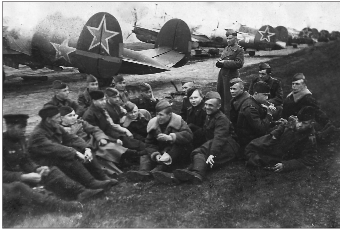
Будни военной службы авиаполка.