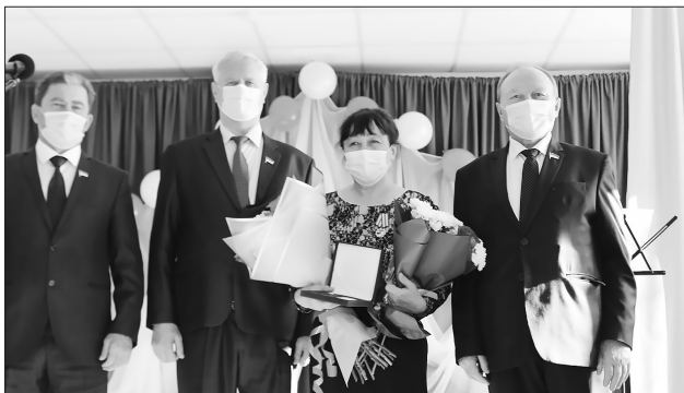
Высокая оценка труда медика