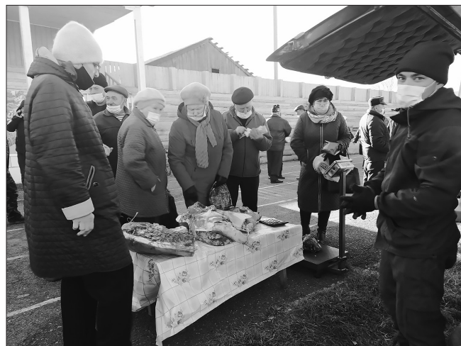
У прилавка ООО «Бичура Лес»

29 октября на Центральном стадионе Бичуры состоялась сельскохозяйственная ярмарка «Урожай-2021».