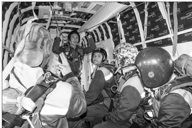
На борту самолёта

Слов нет, мне очень хотелось увидеть парашютный десант в работе, хотя бы в виде тренировки. Она состоялась 5 сентября на территории авиабазы. Примостившись в углу салона, наблюдаю за тем, что происходит. Самолёт, разогнавшись по грунтовке, отрывается от земли, но парашютистов этот момент, похоже, не трогает. Ребята сосредоточены, изредка перебрасываются фразами. Выпускающий инструктор парашютно-десантной команды