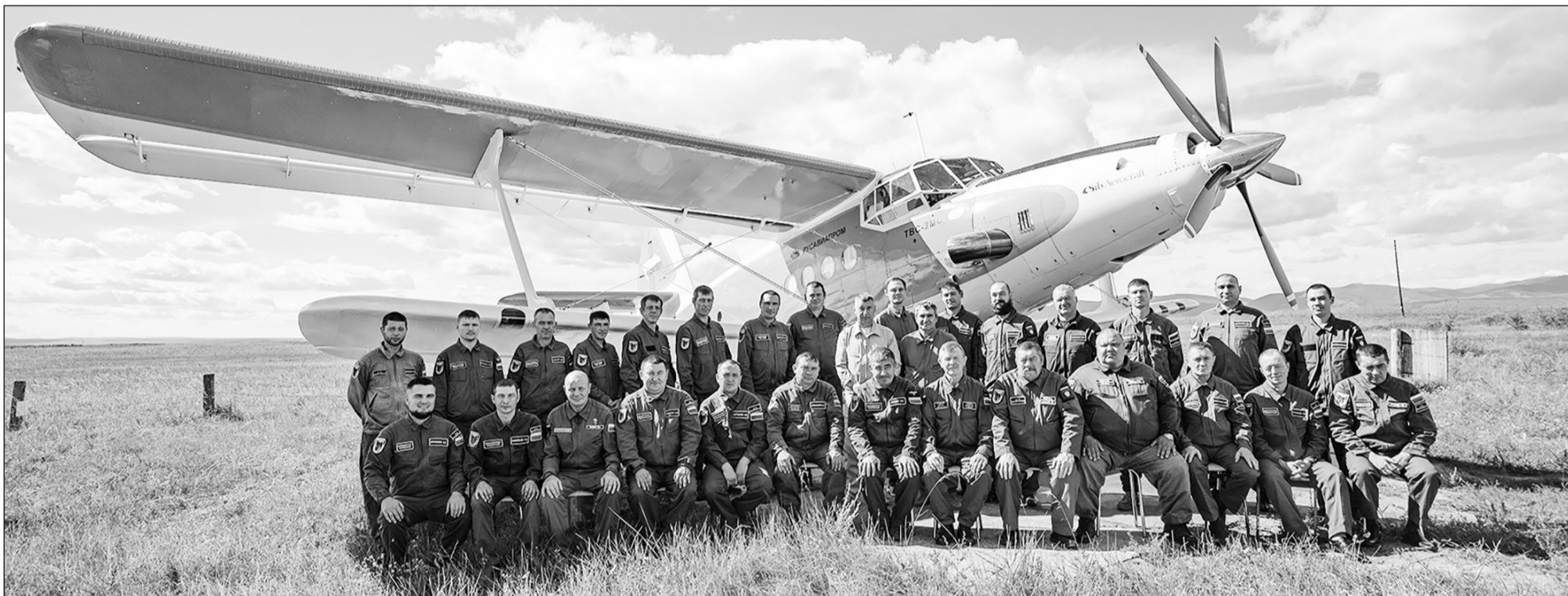
Бичурский отряд Забайкальской авиабазы

В статье «Небесный патруль» я рассказал об авиационном патрулировании лесов в пожароопасный период. Пролетев над тремя районами нашей республики, экипаж проделал важную работу: была осмотрена огромная территория лесов. И даже если пожары не были обнаружены, полёт состоялся не зря, ведь загорания, выявленные на ранней стадии распространения, можно оперативно потушить.