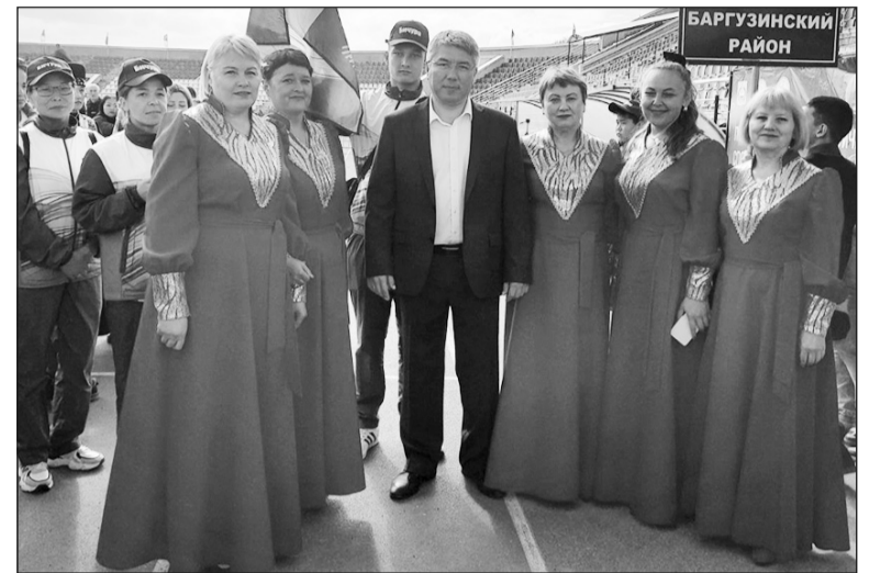
Ансамбль «Полушко» с Главой РБ