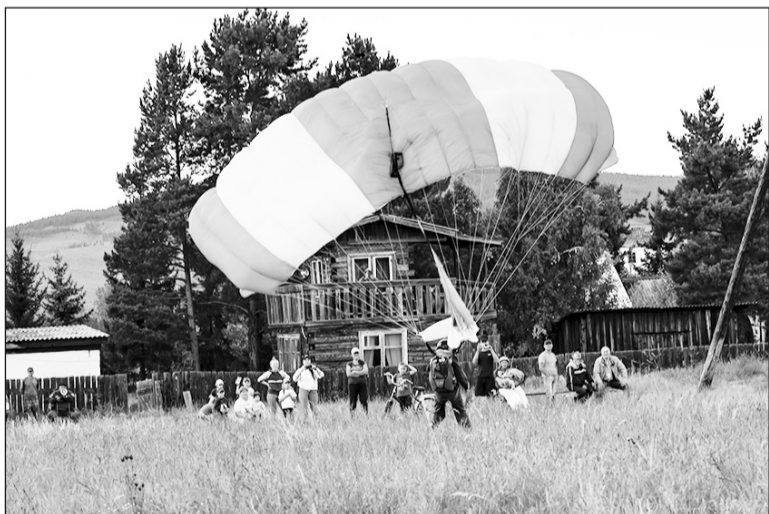
На тренировках — немало зрителей