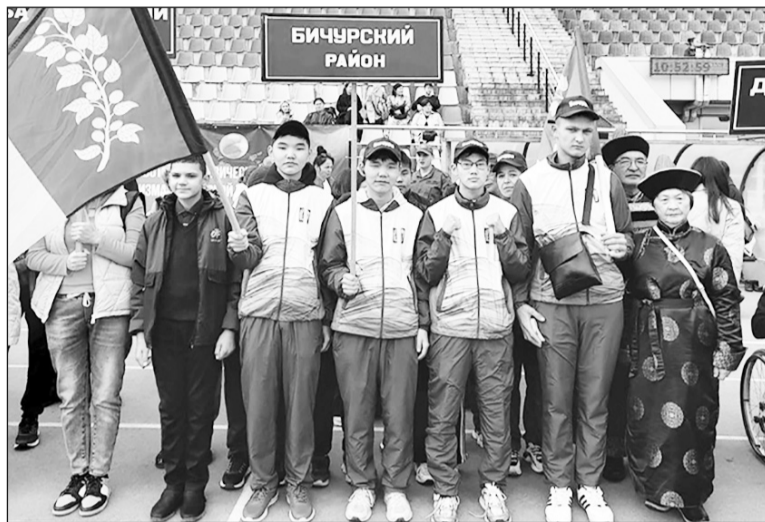
Делегация Бичурского района перед открытием фестиваля

— Каждый участник фестиваля, прошедший специальную военную операцию, делится с нами своим огнём. Совсем недавно прошёл Кубок Защитников Отечества в ДФО, и команда Бурятии убедительно победила. А самое главное, что уже сейчас в сборную России по паралимпийскому спорту входят ребята