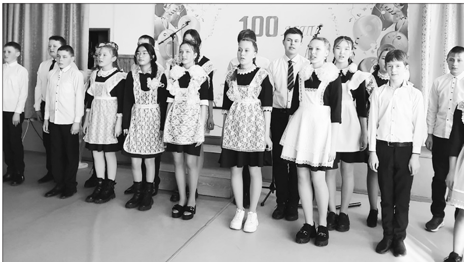
Ученики порадовали концертной программой

24 марта в красочно оформленном актовом зале прошло торжественное мероприятие, посвященное 100-летию юбилею.