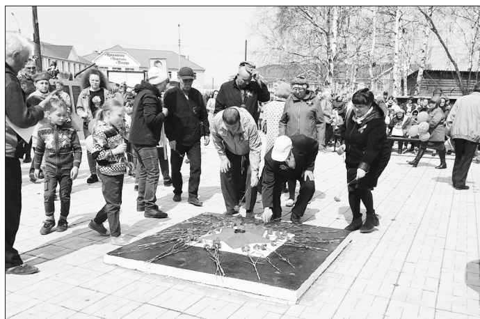
Возложение цветов к вечному огню

День Победы — самый дорогой праздник для каждой российской семьи, для всех и каждого из нас.