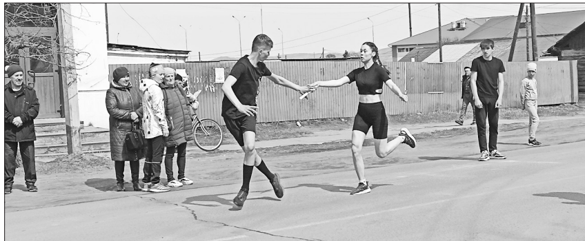
Участники старались в полную силу

5 мая прошла майская легкоатлетическая эстафета на призы газеты «Бичурский хлебороб» и районной администрации. Спортивное мероприятие посвящено празднованию 78-й годовщины Великой Победы.