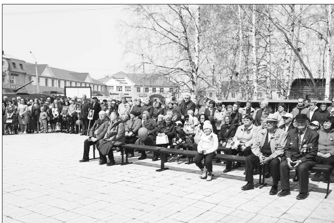
На митинг и стар, и млад пришёл