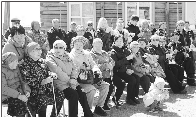
Почти всё население Среднего Харлуна участвовало в событии