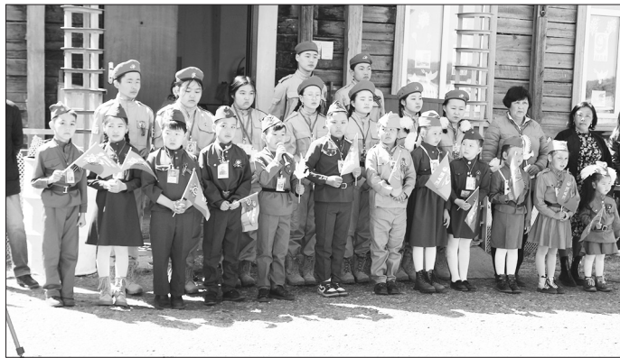
Харлуночские школьники с детства будут знать своих героев