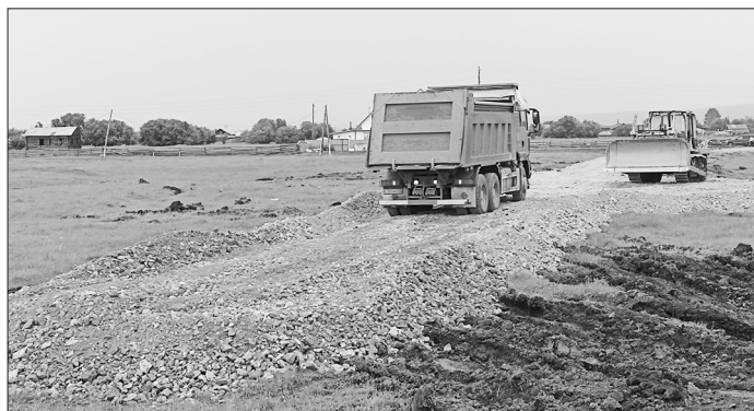
Отсыпка дороги в районе ул. Набережная. 10 июля

В группе «Бичура-инфо» постоянно шла информация о ситуации с подтоплением, извещали население о подвозе чистой воды и прогнозах республиканского гидрометцентра. ЕДДС принимала звонки от жителей и направляла в соответствующие службы. Техника ПЧ-35, ХТО администрации МО «Бичурский район», местных жителей откачивала воду с затопленных участков. Медработники Бичурской ЦРБ провели вакцинацию взрослых и детей против гепатита в зонах подтопления. Сотрудники Центра гигиены и эпидемиологии в РБ провели профилактическую дезинфекцию и раздали памятки жителям.