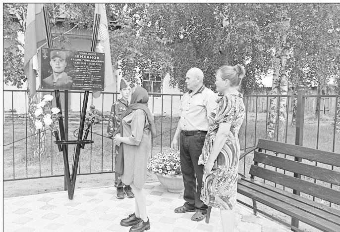
«Герои России останутся в наших сердцах...»