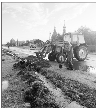
ул. Коммунистическая. Утро 7 июля

Кроме районного центра, в эти дни подтопление произошло ещё в трёх местах. В селе Ара-Киреть по ул. Свердлова сильно затопило один из дворов. На 93 км региональной трассы Мухоршибирь-Бичура-Кяхта в местности реки Ара-Киреть размывло дорожное полотно