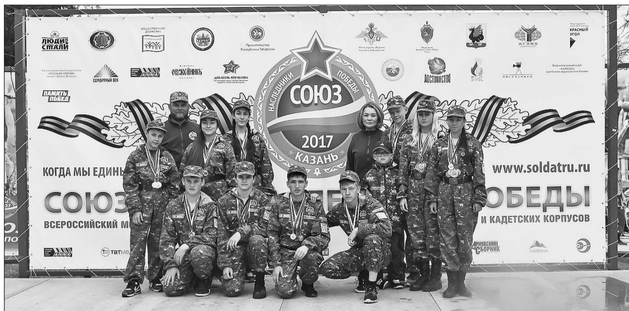
Команда «Соболь» Республики Бурятия