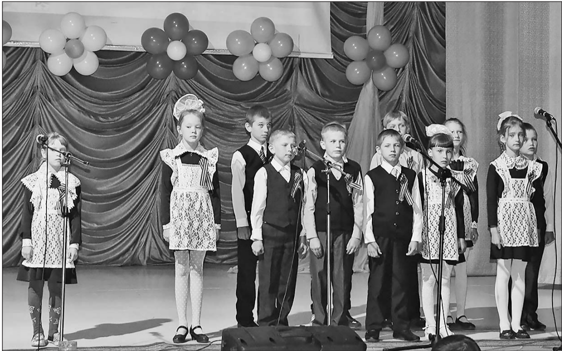
На сцене ученики Бичурской СОШ №4

Местное отделение КПРФ и работники районного Дома культуры традиционно проводят конкурс патриотической песни. В этом году его посвятили 95-летию пионерского движения.