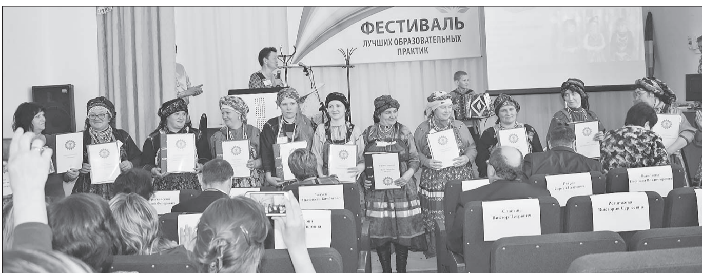
Торжественный момент награждения.