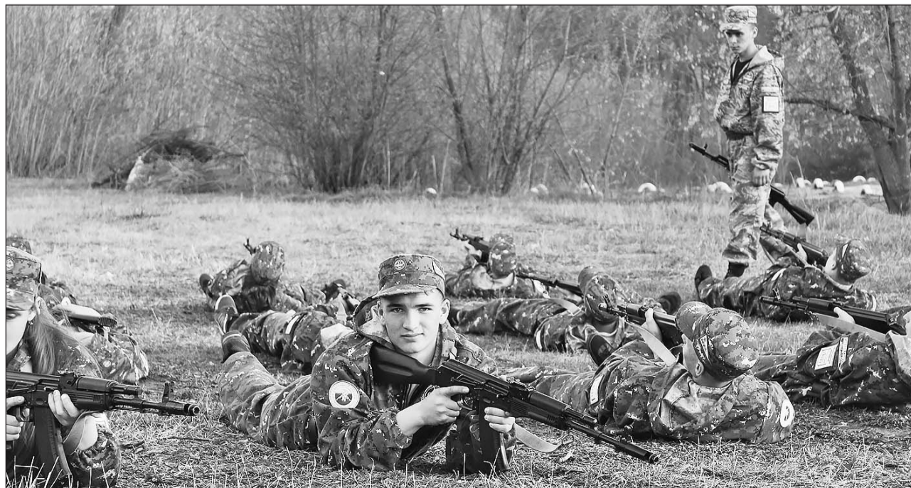
Обучение военной тактике