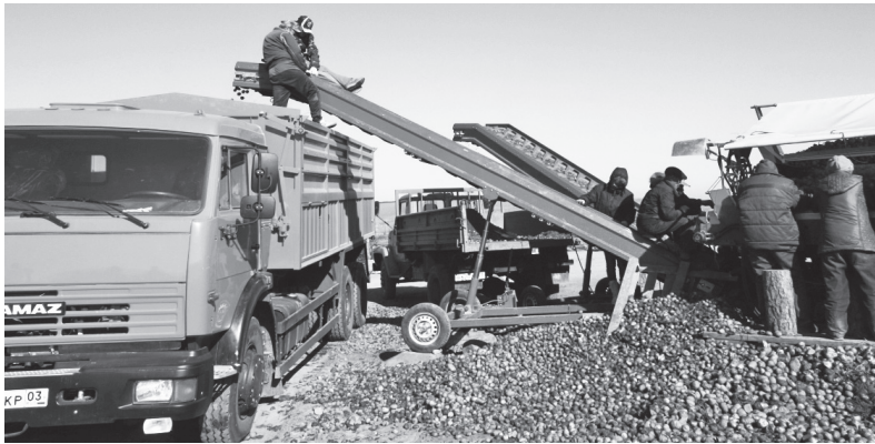
Тяжелая засуха поставила под удар урожай местных сельхозпроизводителей

Потребность в финансовых средствах на закуп кормов в Бурятии составляет 1,9 млрд руб. В связи с этим на организацию закупок кор-