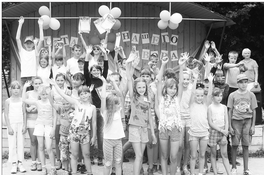
Соревноваться с друзьями и сверстниками всегда интересно

По итогам слёта победа досталась команде «Казачата», на втором месте — «Торнадо», «Апельсин» и «Озорные ребята», на третьем — «Озор-