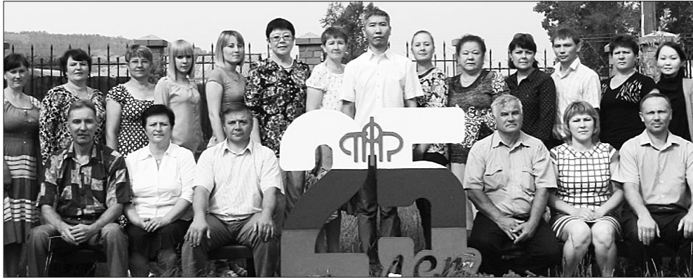
Дружный коллектив — залог успеха

Пенсионный фонд Российской Федерации — крупнейшая организация России по оказанию социально-значимых государственных услуг гражданам