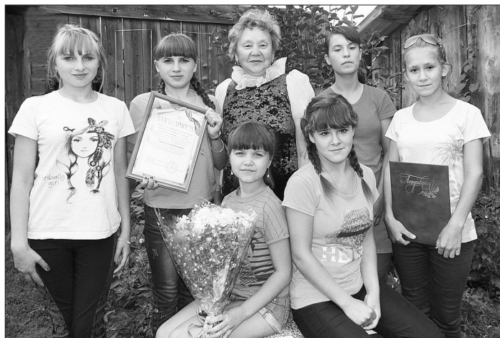
У приёмной мамы все дети равны

Конкурсы способствуют сплочению семейного коллектива