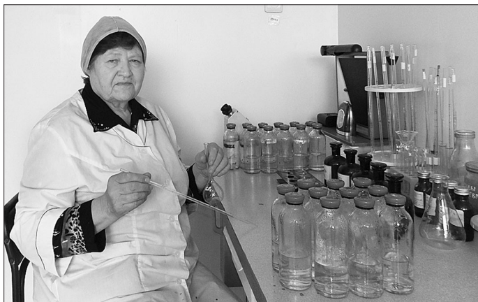
Опытный фармацевт знает своё дело до тонкостей

— Подала документы, потом поехала сдавать экзамены. Народу много, городские барышни за руку с мамками-папами, а мы, деревенские — сами по себе. Но, ничего, экзамены сдала хорошо, вернулась домой ожидать результатов. А тогда многие ходили за орехами, чтобы иметь хоть какую-то прибавку к домашнему бюджету. Вот и я со старшими братьями отправилась в тайгу. Тем временем пришёл вызов на учёбу. В до-