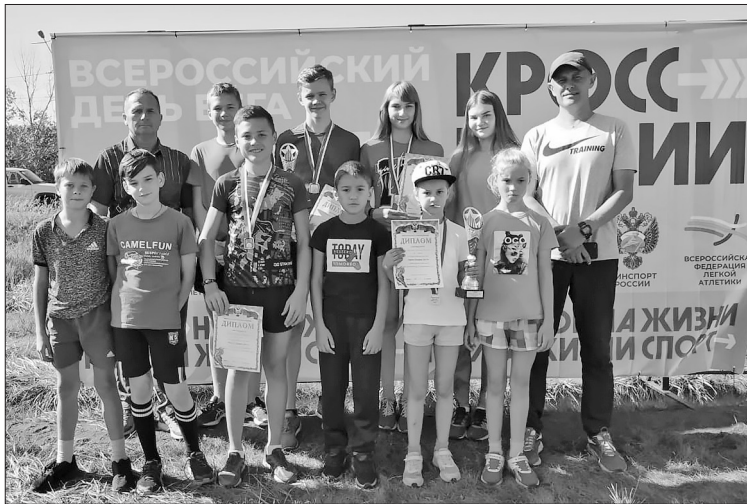
Гордость и надежда Бичурского района

21 сентября в Улан-Удэ на Верхней Березовке прошёл ежегодный всероссийский день бега «Кросс нации — 2019».