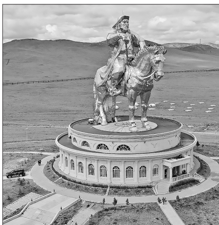
Памятник Чингисхану в Цонжин Болдоге