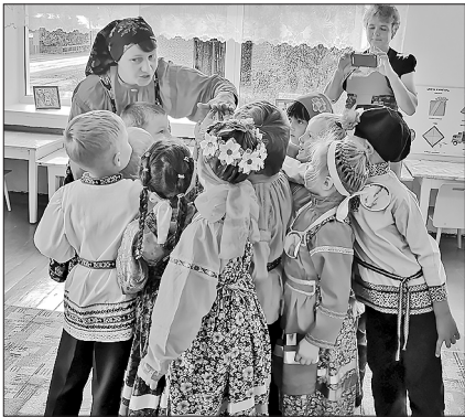
На площадках фестиваля