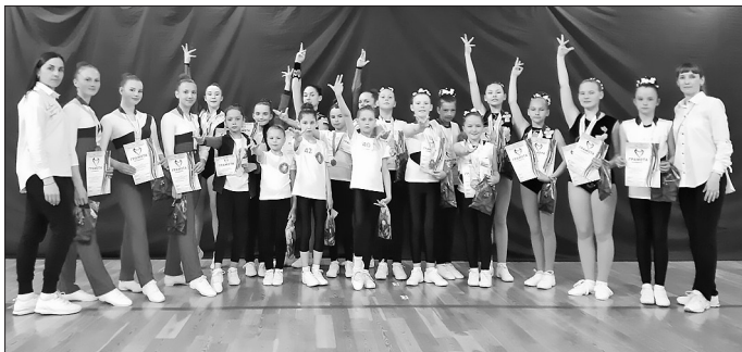
Республиканские соревнования по спортивной аэробике