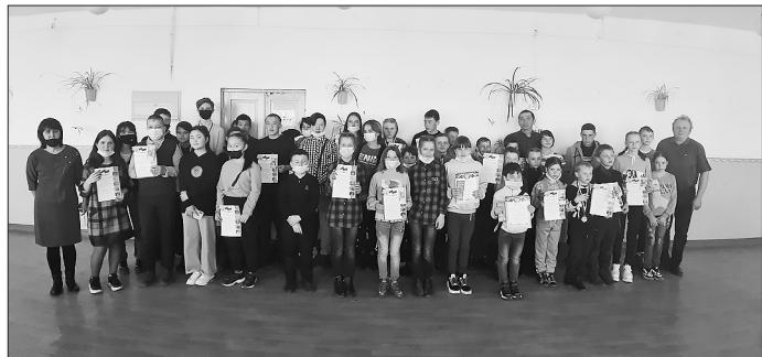
Первенство Бичурской ДЮСШ по шашкам