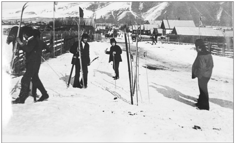
Подготовка к лыжным гонкам