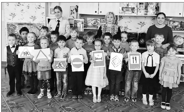
В «Огонёк» дружат с ПДД

Как сделать так, чтобы улицы и дороги стали для наших детей безопасными? Конечно, учить их правилам с раннего возраста. В детском саду «Огонёк» провели мероприятие по правилам дорожного движения.