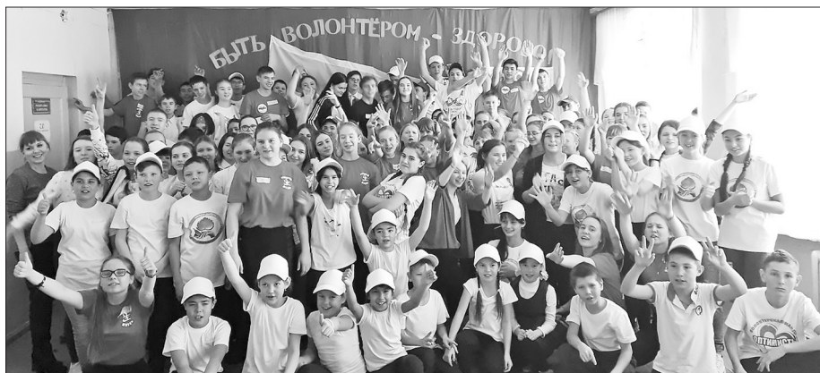
«Добро твори не ради славы, а по велению души!»

В Киретской школе 12 декабря прошёл районный слёт волонтеров, приуроченный к Международному дню добровольца и Международному дню борьбы со СПИДом.