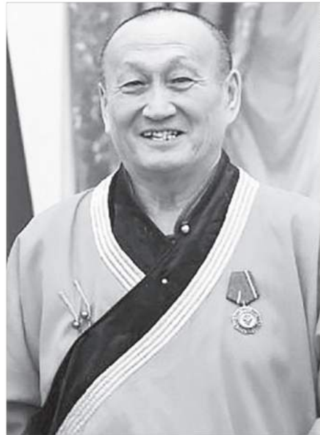
СКРИНШОТ С ВИДЕО

— Очень важно принять участие в выборах. Почему важно? Потому что наша страна стоит перед выбором и этот выбор нужно сделать. Поэтому приглашаю вас прийти и отдать свой голос. Тем самым мы покажем, что мы едины, самостоятельны и добровольно отдаем свои голоса ради будущего России!