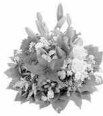
С уважением Бичурское РАЙПО

Среди весенних первых дней 8 Марта всех дороже. На всей земле, для всех людей Весна и женщины похожи. Успехов вам, здоровья вам И счастья пожелаем, И с первым праздником весны Сердечно поздравляем!