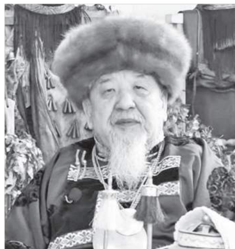
СКРИНШОТ С ВИДЕО

— Сейчас наша страна, общественность переживают переломный момент, когда вокруг нас идет большая негативная энергия. Нас связывает многое — история, традиции, культура предков, которую нам передали наши отцы и деды. У нас огромная история и мы все это пережили. Сегодня пришел момент истины, чтобы мы все это передали нашим внукам, правнукам, своему потомству. Сегодня у нас выборы президента России. Сегодня я обращаюсь к вам, дорогие земляки. Обращаюсь с тем словом, чтобы мы все сплотились и пошли на выборы. Я думаю, что мы достойно вы-