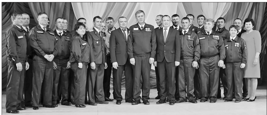
На сцене РДК