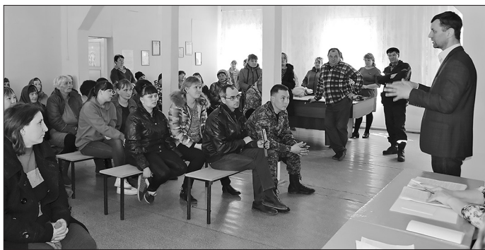
На сходе в Потанино

Ежегодные сходы граждан — место, где встречаются сельчане и представители власти и где люди могут напрямую задать волнующие их вопросы.