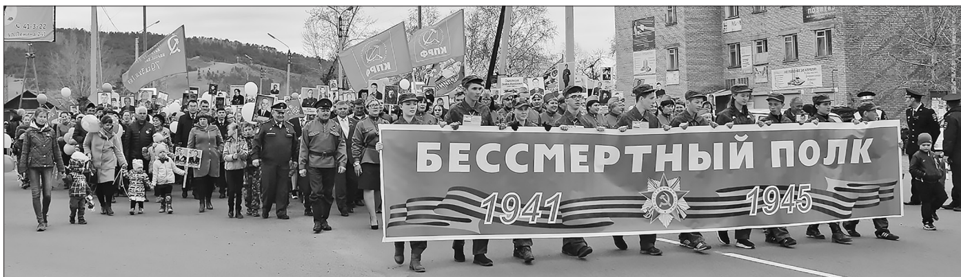
Нет праздника важнее и дороже

День памяти и глубокого уважения подвигу народа провели в Бичуре