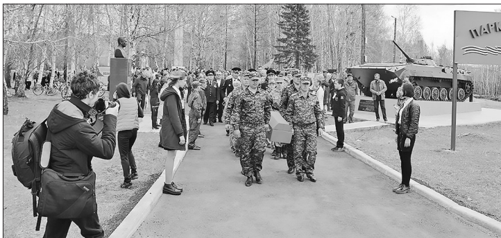
Проститься с солдатами пришло много бичурянин