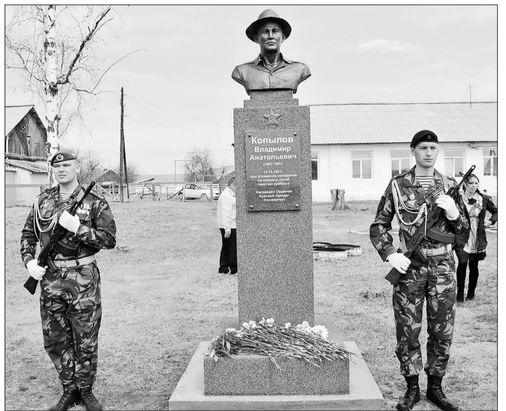
В Почётном карауле сотрудники спецподразделения «Кречет»